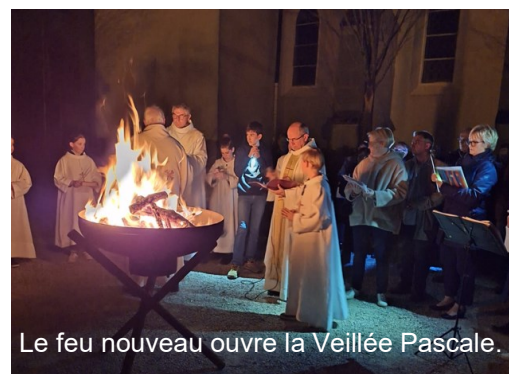
Le feu nouveau ouvre la Veillée Pascale.

LE SACREMENT DES MALADES sera donné à Nâves- Parmelan DIMANCHE 28 AVRIL