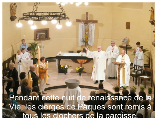
Pendant cette nuit de renaissance de la Vie, les cierges de Pâques sont remis à tous les clochers de la paroisse.