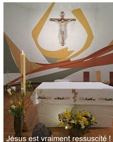
Jésus est vraiment ressuscité !